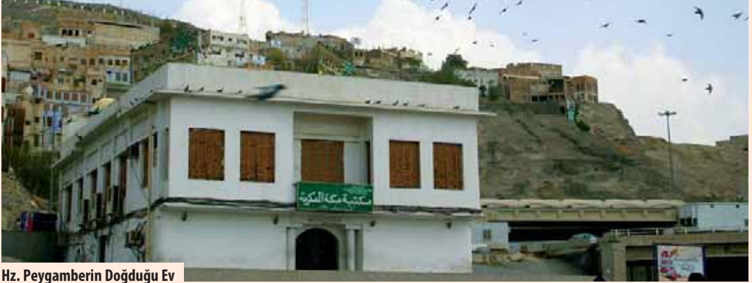
Hiz. Peygamberin Doğduğu Ev

Peygamber Efendimiz, babasının ölümünden sonra doğan bir çocuk olduğu için, dedesi Abdulmuttalib'in himayesi altında büyümeye başladı. O dönemin bir geleneği olan Mekke'nin ileri gelen ailelerinin çocuklarını, yaylanın sağlıklı havasında büyümeleri için göçebe (bedevi) kabilelerden bir sütanneye verme işi, küçük Muhammed için de gerçekleştirildi. Bu bağlamda o, Taif yakınlarında yaşayan Hevâzin kabilesinin Sa'd b. Bekr koluna mensup bir kadın olan Halime'ye verildi.